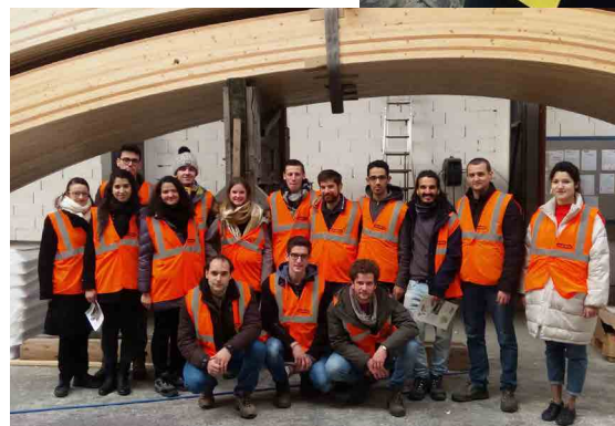
Voyage d'études et visite d'entreprises pour les élèves ingénieurs en 3 ème année production.