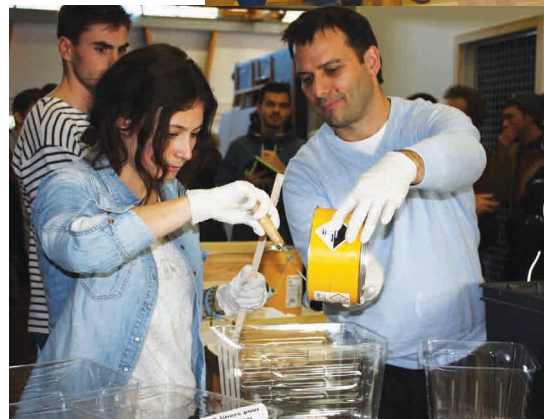
Premier ingénieur double diplômé ESB / Université Bio-Bio au Chili.