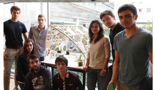
Workshop Speed défi sur le thème des espaces d'exposition.