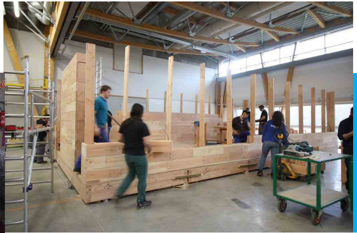
Construction de « Wood Stock », un habitat modulaire imaginé dans le cadre du concours de microarchitecture Mini maousse.